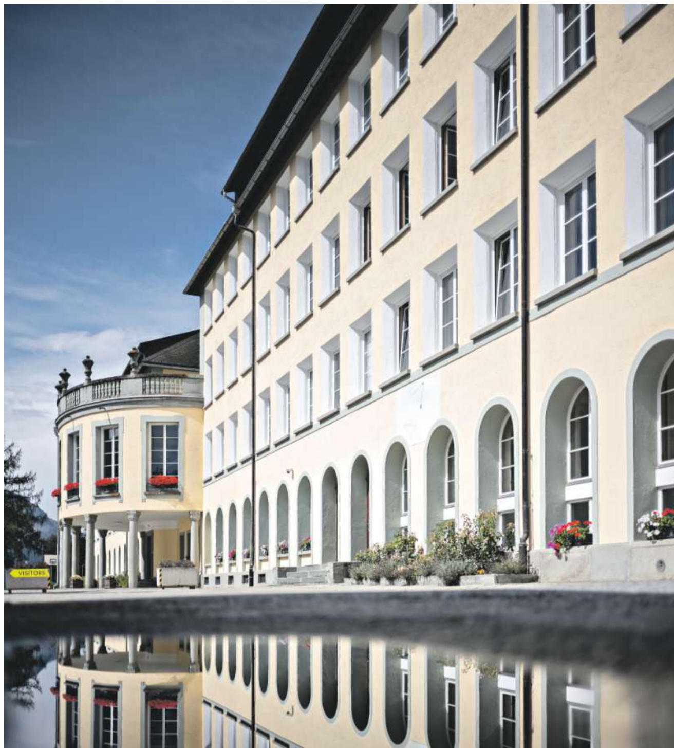
Hinter dem Haus grasen morgens die Rehe: Ein Palast für den ambitionierten Wintersportnachwuchs.

Von Mirko Plüss (Text) und Michele Limina (Fotos)