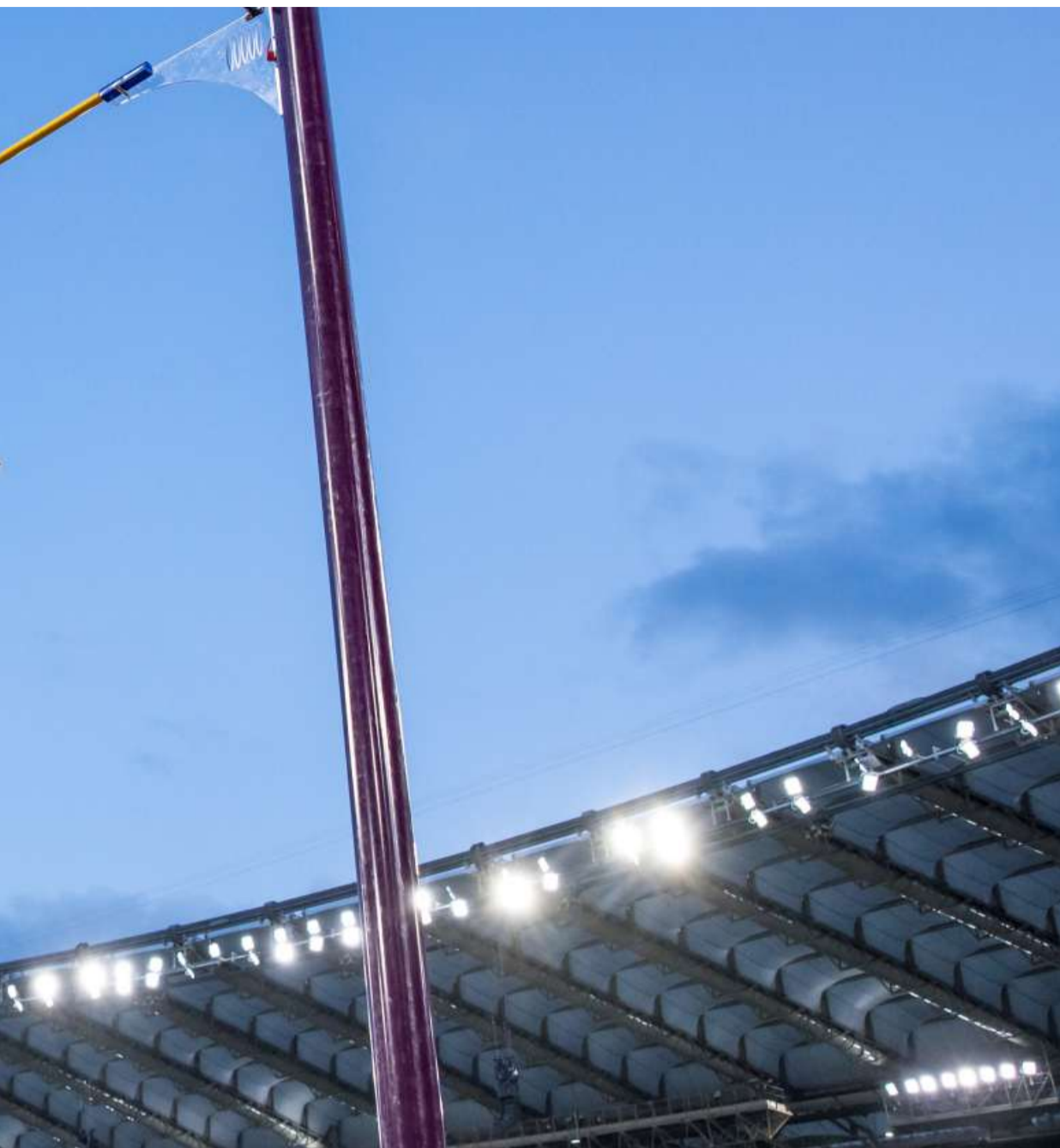
Spielen in Paris verpasst sie das Podest trotz neuer persönlicher Bestleistung (4,88 m) dennoch knapp.