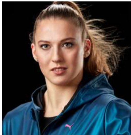
Stabhochspringerin Angelica Moser studiert BWL in Bern