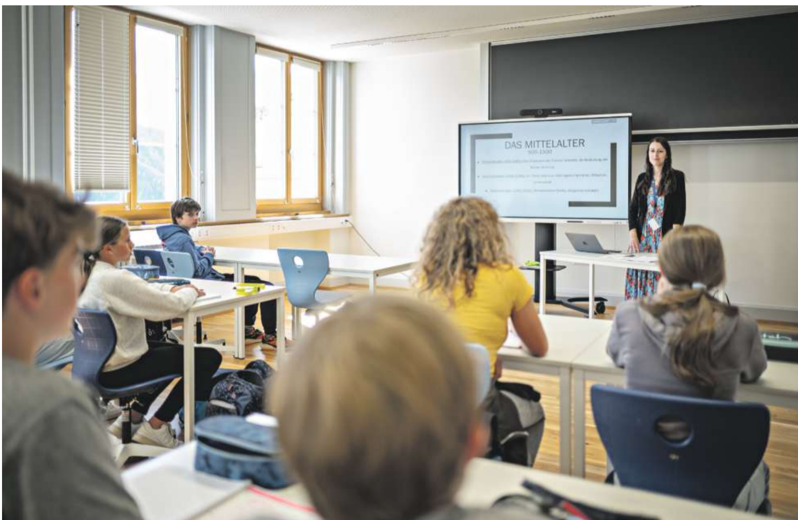
Die Jugendlichen absolvieren die Matura in Deutsch und Romanisch oder in Deutsch und Englisch. Einige wohnen im hauseigenen Internat.