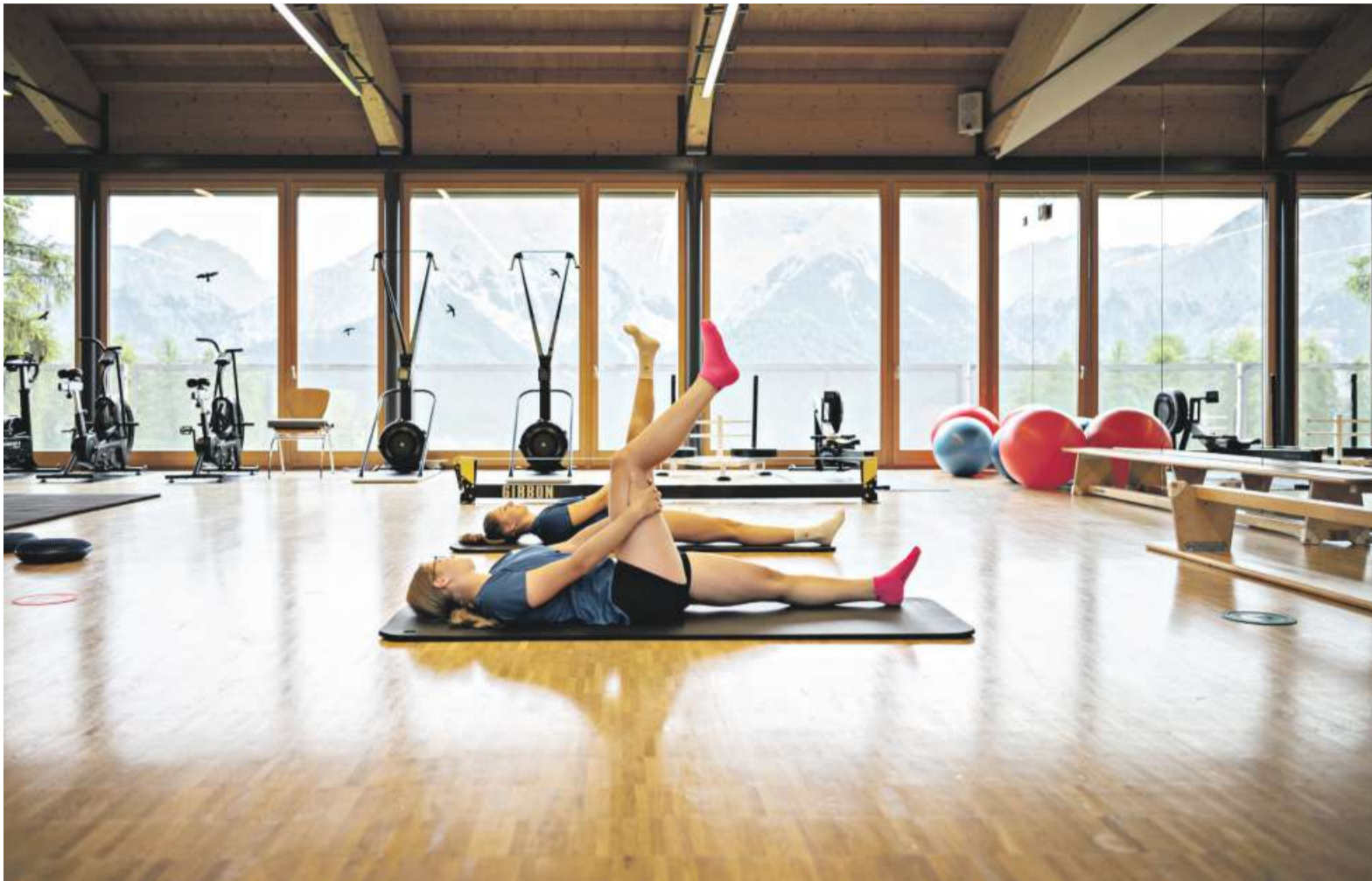
Krafttakt mit Aussicht: Zwei Schülerinnen beim morgendlichen Training im Sportraum.